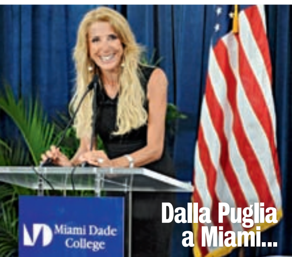
Dalla Puglia a Miami...